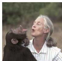
Jane Goodall (à confirmer) Éthologue et anthropologiste