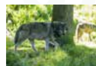
Canis lupus lupus