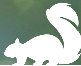
TABLE RONDE 2 : LA NATURE EN VILLE, C'EST UNE VILLE EN VIE - LA VILLE RENATURÉE