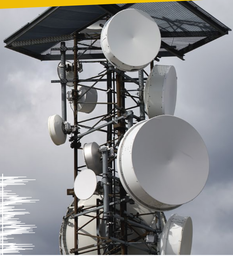
TABLE RONDE 1 : LE POIDS DES ONDES, L'HYPERSENSIBILITÉ AUX ONDES ÉLECTROMAGNÉTIQUES.